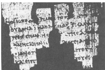
Le papyrus « John Rylands » Papyrus : Feuilles de roseaux cousues côte à côte sur lesquelles on écrivait. Le papyrus était bien meilleur marché que les peaux d'animaux dont on se servait également.

Il y a mieux ! Nous avons, d'Egypte, les « papyrus » dont les plus remarquables sont les « Chester Beatty » (à l'Université de